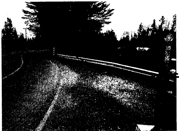
Fotografía N°2, de 02/10/2014: Superficie finalmente intervenida del lote N°4.