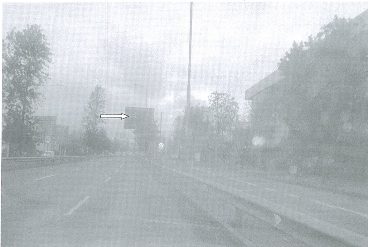
POWER GRAPHICS : LED, RUTA-70, KM. 15.900, sentido ascendente.

ASESORIA JURÍDICA DIRECCIÓN DE VIALIDAD REGIÓN METROPOLITANA