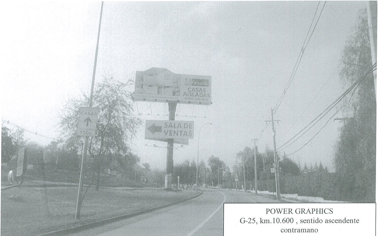
POWER GRAPHICS G-25, km.10.600, sentido ascendente contramano

ASESORIA JURIDICA DIRECCION DE VIALIDAD REGION METROPOLITANA