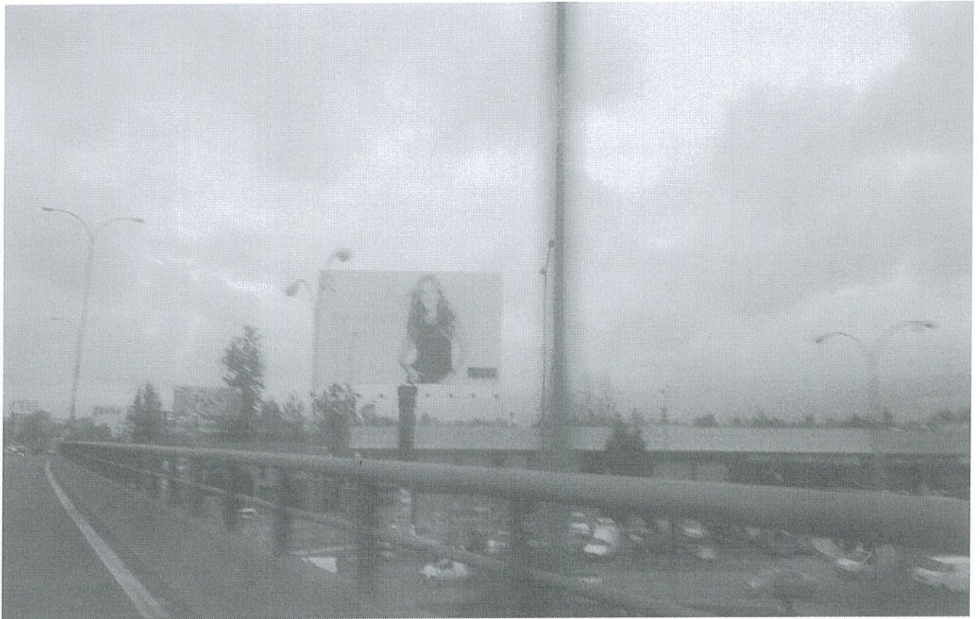
RUTA-70, KM. 15.500, sentido ascendente.

ASESORIA JURIDICA DIRECCION DE VIALIDAD REGION METROPOLITANA