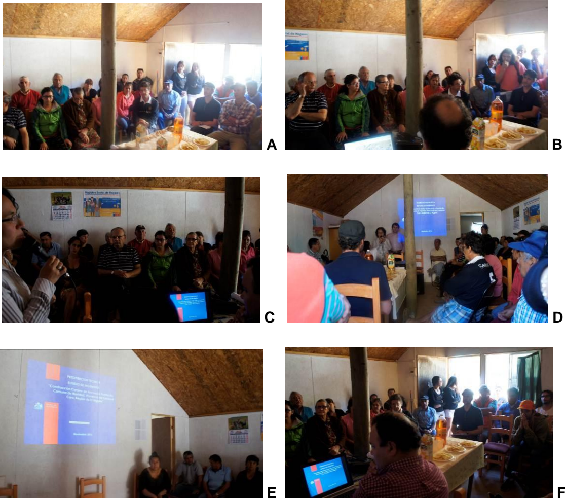
Foto 2. Bienvenida y presentación técnica de estudio de ingeniería “Construcción Camino de acceso a Puertecillo, Comuna de Navidad, Provincia de Cardenal Caro, Región de O’Higgins”