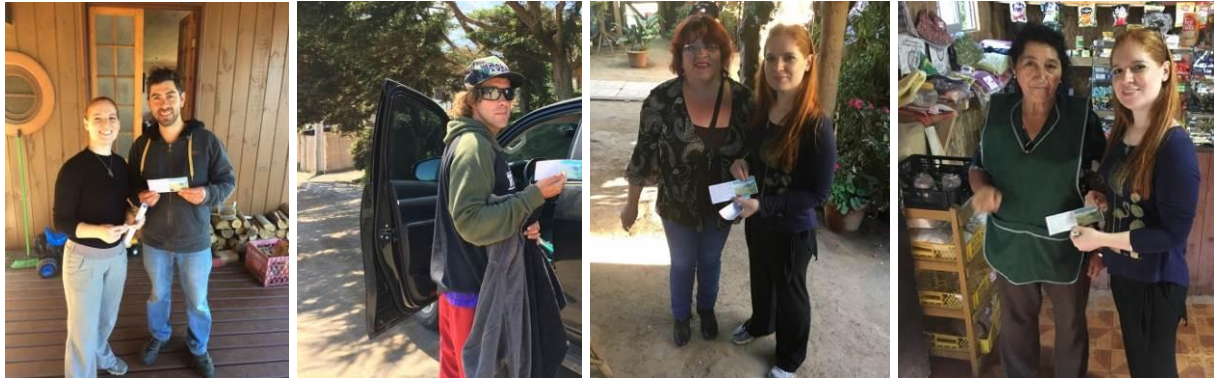
Foto 1. Entrega de invitaciones Residentes de Puertecillo y Tumán