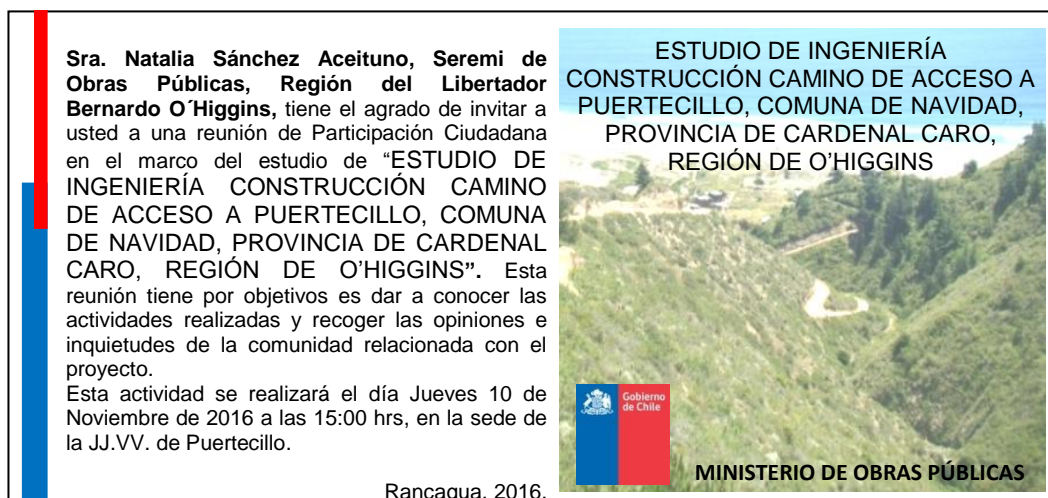
Figura 1. Tarjetones de invitación a evento.