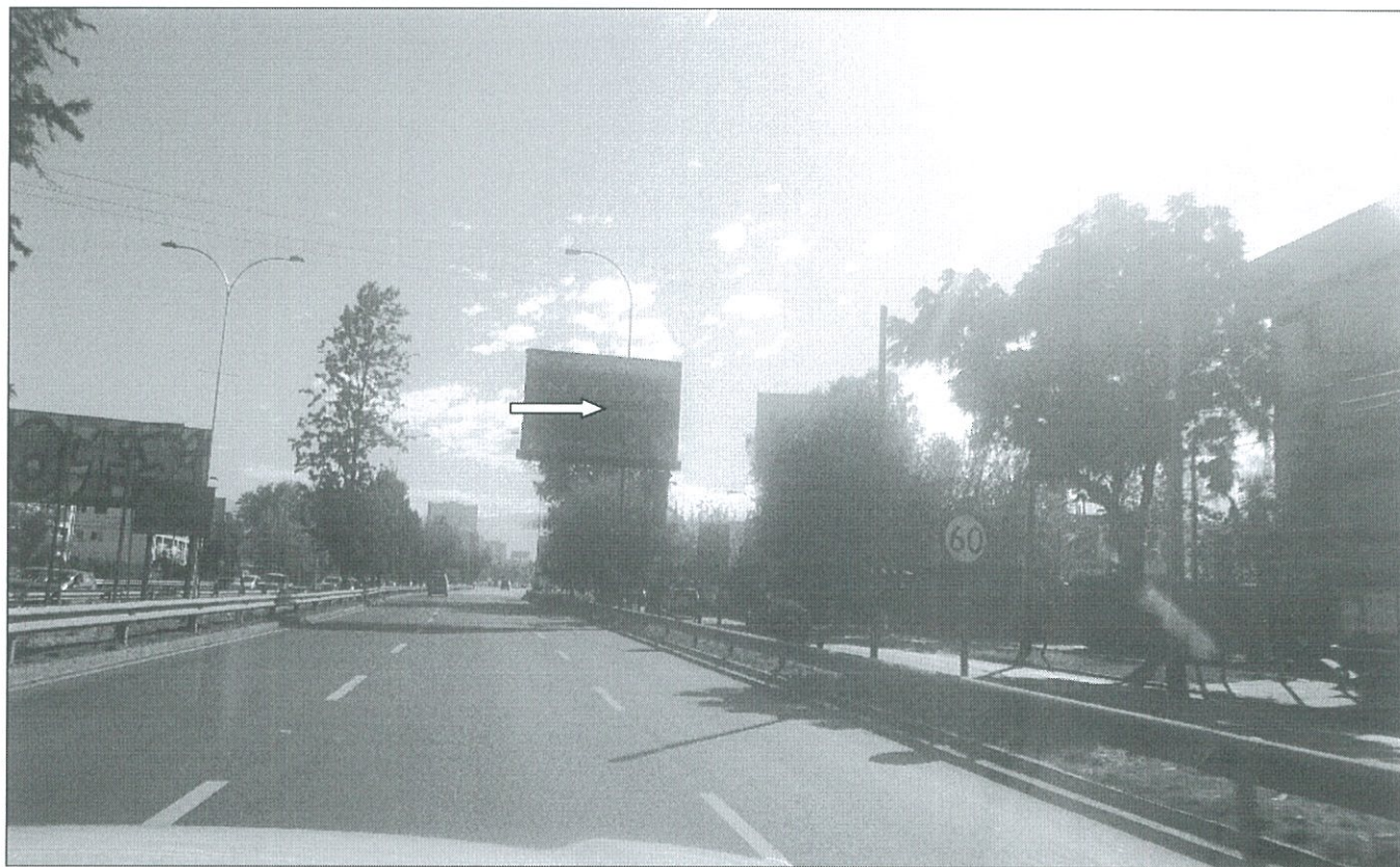
POWER GRAPHICS : LED, RUTA-70, KM. 15.900, sentido ascendente.